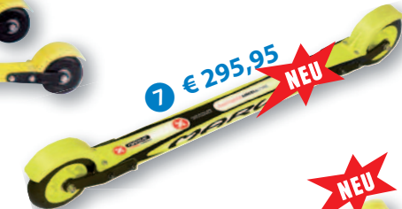
7 € 295,95

5 MARWE ROLLSKI SKATE 610 Trainingsrollski der Profis sowie Testsieger Rollskitest 2008! Das „Arbeitsgerät“ zahlreicher Nationalteams. Dank überragender 105 mm PU Rollen und 610mm Marwe Composite Holm beste Führung und Dämpfung für den ambitionierten Läufer beim Skaten. Unübertroffen Performance durch seinen einzigartigen flexiblen Kunststoffholm; inklusive Schutzbleche. Lieferbar mit Rollwiderstand: minimal (US0), medium (US6), medium/maximal (US7), maximal (US8); verschiedene PU Mischung der Räder; Holm: Marwe Composite Wabenkern; Achsabstand: 610 mm; Rollendurchmesser: 105 mm; Rollenbreite: 25 mm; Rollenmaterial: Urethan 10MAR610Skate € 279,95