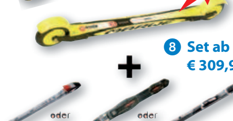
8 Set ab € 309,95