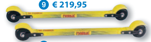
9 € 219,95