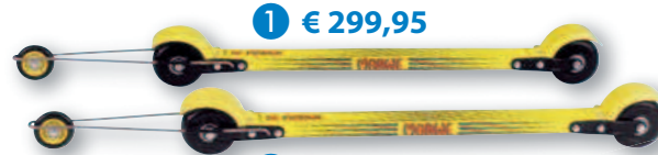
1 € 299,95

Der Testsieger Rollskitest 2008! Komfortabler Trainingsrollski für die klassische Technik. Trainingsgerät zahlreicher Skilanglauf Nationalteams mit 700 mm federndem Compositeholm mit rutschfesten, weichen 80 mm Gummirollen für sicheren Geradeauslauf (40 mm Breite) bei höchstem Dämpfungskomfort und bester Führung; inklusive Schutzbleche und Rückrollsperrung am Vorderrad. Lieferbar mit Rollwiderstand: minimal (6C0), medium (6C6), maximal (6C7/6C6); verschiedene Gummimischung der Räder; Holm: Marwe Composite Wabenkern; Achsabstand: 700 mm; Rollendurchmesser: 80 mm; Rollenbreite: 40 mm; Rollenmaterial: Gummi 10MAR101 € 269,95